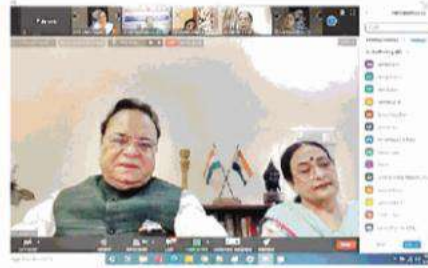
ਸਮਾਗਮ ਦੌਰਾਨ ਪੇਸ਼ਕਾਰੀ ਦਿੰਦੀਆਂ ਵਿਦਿਆਰਥਣਾਂ। (ਸੱਜੇ) ਆਨਲਾਈਨ ਸਮਾਗਮ ਦੌਰਾਨ ਸੰਬੰਧਨ ਕਰਦੇ ਸੰਸਦ ਮੈਂਬਰ ਸੰਤੋਖ ਸਿੰਘ ਚੌਧਰੀ

ਇਸ ਤੋਂ ਅਨਲਾਈਨ ਸਿੱਖਿਆ ਪ੍ਰਾਪਤ ਕਰ ਰਹੀਆਂ ਵਿਦਿਆਰਥੀਨਾਂ ਨੂੰ ਸੰਬੰਧਤ ਕਰਵਾਉਣਾ ਹੁੰਦਾ ਹੈ ਅਤੇ ਇਸ ਤੋਂ ਇਸ ਸਮੇਂ ਬਹੁਤ ਸਾਰੀਆਂ ਬੱਚੀਆਂ ਨੂੰ ਤਨਾਅ ਹੈ ਜਿਸਦੀਆਂ ਭਾਵਨਾਵਾਂ ਭਰਪੂਰ ਹਨ। ਉਨ੍ਹਾਂ ਯਕੀਨ ਵਿਚਦਾਇਕ ਕਿ ਹਾਲਾਤ ਠੀਕ ਹੁੰਦੀਆਂ ਹੀ ਇਨ੍ਹਾਂ ਸਮੱਸਿਆਵਾਂ ਨੂੰ ਠੀਕ ਕਰ ਦੇਣਗੀਆਂ। ਇਹ ਪੜ੍ਹਨ ਵਾਲੀਆਂ ਵਿਦਿਆਰਥੀਨਾਂ ਲਈ ਵਿਸ਼ੇਸ਼ ਪ੍ਰਬੰਧ ਕੀਤੇ ਜਾਣਗੇ। ਇਸ ਦੇ ਨਾਲ ਹੀ ਨੌਜਵਾਨਾਂ ਅਧਿਐਨ ਪੂਰਾ ਕਰਨ ਲਈ ਸੰਯੁਕਤ ਹਾਲਾਤ 'ਚ ਅਨਲਾਈਨ ਕਰਵਾਈ ਜਾ ਰਹੀ ਪੜ੍ਹਾਈ 'ਤੇ ਸੰਤੁਸ਼ਟੀ ਦਿਖਾ ਕੀਤੀ ਅਤੇ ਕਿਹਾ ਕਿ ਭਾਰਤੀ ਸੰਸਕ੍ਰਿਤੀ 'ਚ ਗੁਰੂ ਸਿੱਖ ਦੇ ਸਿੱਖਣ