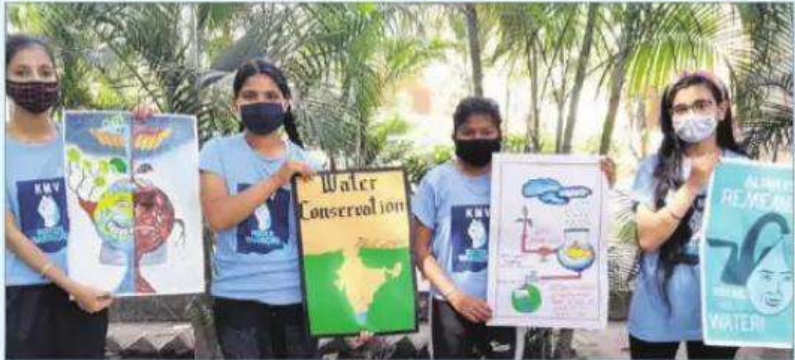
SWEET NECTAR: Students of KMV give a message of water conservation.

Kanya Maha Vidyalaya organised an online poster-making competition to celebrate World Water Day to spread awareness about water conservation. The event was organised by the Department of Environment Science. KMV's Water Warriors team participated to showcase their creativity. Students emphasised on saving water in regular use and also apprised people about the ways to save water. Students made posters and slogans to inculcate values of water conservation among people. The role of water warriors is spreading awareness about the importance of water conservation, ensuring that clean drinking water reaches