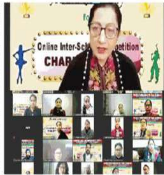
कमिशन-2020 प्रतिस्पर्धियों के विज्ञापनों के सम धारित कनती हुई केएससी को प्रिंसिपल प्रो.

स्कूल किल्लरों की दमिस्त की विजिता है। इसके अन्तर्गत वैज्ञानिक योग्यता प्रतियोगिता में संस्कृत, कम्प्यूटर, गणित, कविता, गीत व पलक महोत्सव, फुटबॉल, बैडमिन्टन, कबड्डी, बालों पर सोनियर सेकेंड, बालों की कंग्रेस, गीत, संस्कृत, गणित में टैलेंट प्रदर्शन, पब्लिक स्पीकिंग, लुचियाना की खोज, बिजनेस टैलेंट प्रयोगिता में कम्प्यूटर, साइबल, सोनियर सेकेंड, गणित की खोज व न्यूटन-वॉल्टे नेम प्रतियोगिता में डीआरबी डेवेलोपमेंट, पब्लिक स्कूल किल्लरों की मनमंथ विजिता है। प्रिंसिपल अंतिमा सार्न ने कम्प्यूटर क्विज पर स्कूल को अर्जेंट ट्रीन दीपक अ