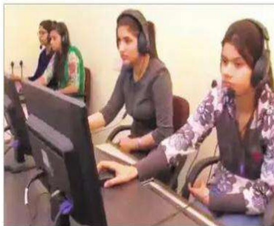
Students of KMV's IELTS Institute attend a session on the campus.

Now, the institutes have begun offering on-campus IELTS coaching and most recently have even opened firms to facilitate immigration of students. "Certainly, this trend is not going to settle in