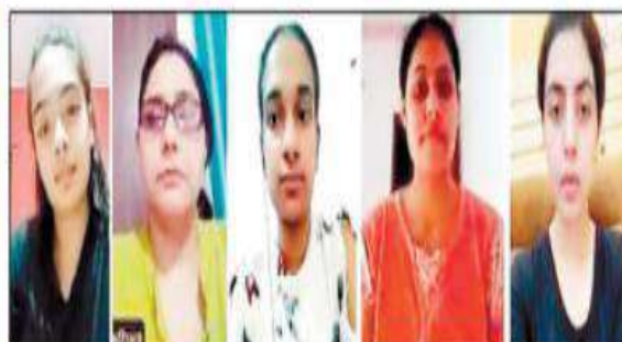
ऑनलाइन क्लासिस में भाग लेते कालेज के साइकोलॉजी विभाग की छात्राएं।