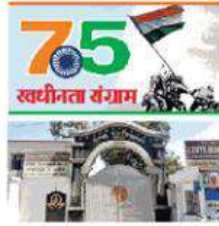
कन्या महाविद्यालय का गेट। कालेज में स्थापित शहीद-ए-आजम की प्रतिमा • जालंधर