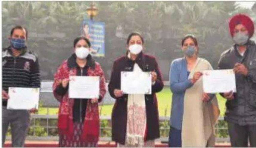
KMV staff members show appreciation certificates awarded to them by the National Institute of Technical Teachers Training and Research, Chandigarh, for its contribution to Unnat Bharat Abhiyaan.