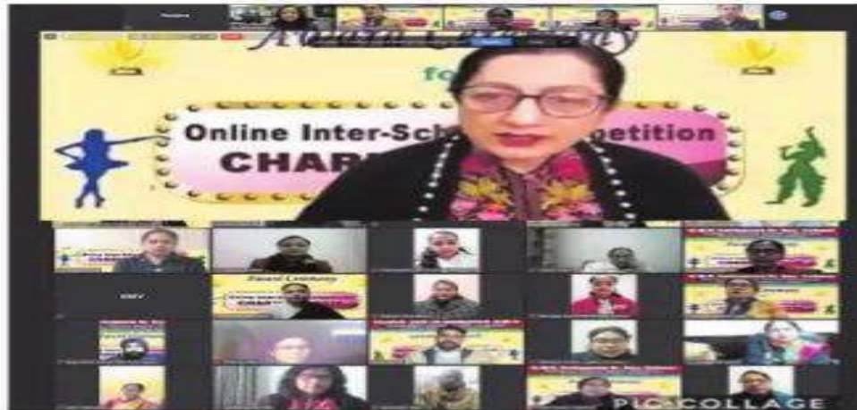
KMV Collegiate Sr Sec School had organised an online inter-school competition titled 'Charisma-2020' which included various events.