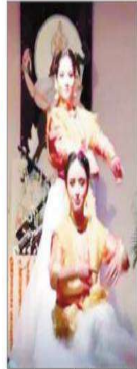
सरस्वती पूजन करती कॉलेज की छात्राएं।